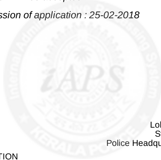
Loknath Behera IPS State Police Chief Police Headquarters, Thiruvananthapuram

The last date for submission of application : 25-02-2018